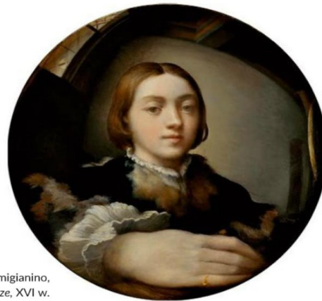
Parmigianino, Autoportret w wypukłym lustrze, XVI w.

Włoski artysta Parmigianino [czyt.: parmizianino] miał zaskakujący pomysł na zaprezentowanie siebie jako utalentowanego twórcy. Do obserwacji własnego ciała użył wypukłego lustra i odwzorował zniekształcenia na równie wypukłym podłożu. Zabieg zastosowany przez malarza sprawił, że jego prawa dłoń, umieszczona na pierwszym planie, jest nienaturalnie powiększona i dominuje w przedstawieniu. Artysta podkreślił jej znaczenie jako narzędzia twórczej pracy. Zasugerował ponadto, że dzięki swoim mistrzowskim umiejętnościom potrafił wykonać tak niezwykle dzieło lewą ręką – prawa dłoń widnieje bowiem nieruchomo na portrecie.